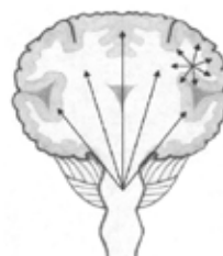
Konvulzije koje započnu u jednom dijelu mozga mogu se proširiti i zahvatiti cijeli mozak, pa tada postaju sekundarne generalizirane konvulzije.