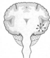
Parcijalne ili fokalne konvulzije nastaju u jednom dijelu mozga.

Jednostavne parcijalne konvulzije su lokalizirane konvulzije koje djeluju na samo jedan dio mozga. Simptomi koje osoba ima ovisе o funkciji koju taj dio mozga kontrolira. Konvulzije mogu uzrokovati nedobrovoljne kretnje ili ukočenje jednog od udova, osjećaj "već viđenog" (déjà vu), neprijatan miris ili okus, ili senzaciju u stomaku poput 'leptira' ili mučnine. Osoba je tijekom cijele konvulzije potpuno pri svijesti. Konvulzija obično traje manje od jedne minute, a osoba se nakon toga oporavi. Kada se parcijalna konvulzija raširi i obuhvati cijeli dio mozga, ona se tada naziva sekundarnom generaliziranom konvulzijom.