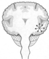
Μερικές ή εστιακές κρίσεις ξεκινούν από ένα μέρος του εγκεφάλου.

Οι απλές μερικές κρίσεις είναι τοπικές κρίσεις, που επηρεάζουν μόνο ένα μέρος του εγκεφάλου. Τα συμπτώματα που έχει το άτομο εξαρτώνται από ποια λειτουργία ελέγχει εκείνο το μέρος του εγκεφάλου. Η κρίση μπορεί να προκαλέσει μια ακούσια κίνηση ή ακαμψία ενός άκρου του σώματος, αίσθηση ντεζαβού, μια δυσάρεστη οσμή ή γεύση, ή δυσάρεστες αισθήσεις στο στομάχι όπως ανακάτεμα ή ναυτία. Το άτομο έχει όλες τις αισθήσεις του καθόλη τη διάρκεια της κρίσης. Η κρίση συνήθως διαρκεί λιγότερο από ένα λεπτό και μετά το άτομο συνέρχεται. Όταν μια μερική κρίση εξαπλωθεί και σχετίζεται με ολόκληρο τον εγκέφαλο, αποκαλείται δευτερογενής γενικευμένη κρίση.