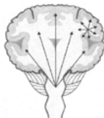
Κρίσεις που αρχίζουν σε ένα μέρος του εγκεφάλου μπορεί να εξαπλωθούν σε ολόκληρο τον εγκέφαλο και να γίνουν δευτερογενείς γενικευμένες κρίσεις.